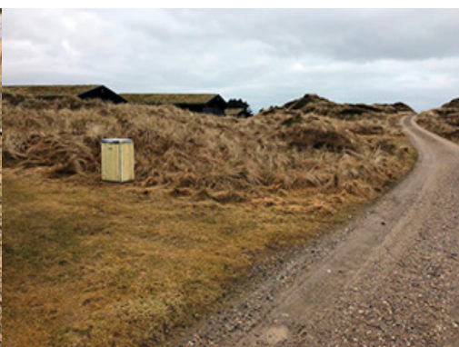
Set fra vejen