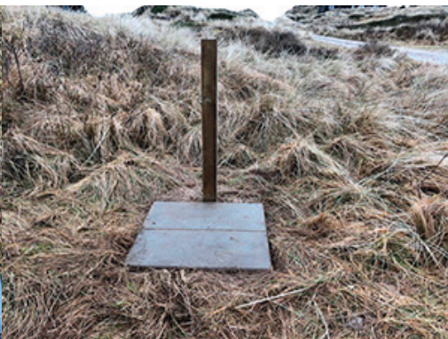
Fliser lagt, stolpe nedgravet