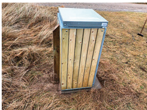
Set fra siden