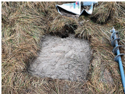
Afrettet til fliser