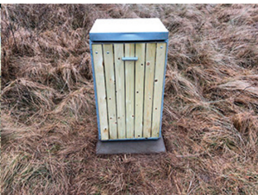
Stativ opstillet og skruet fast i stolpe