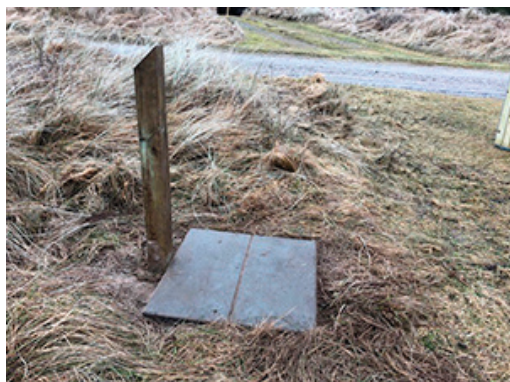
Set fra siden