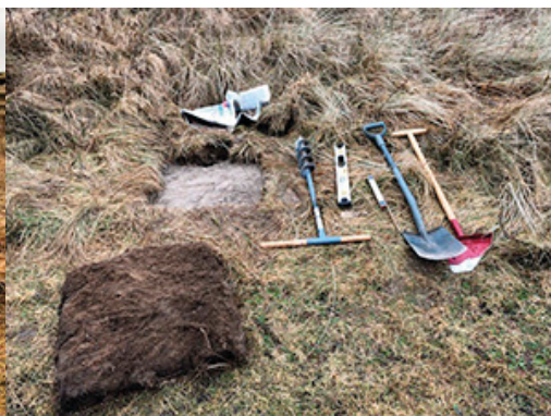
Placering angivet med pind