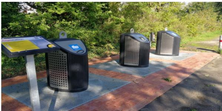
Eksempel på helt nedgravede containere

Ferbæk Ejerlaug har også oplyst følgende: